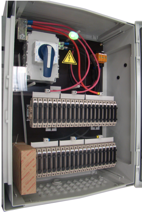
Exemplo de caixa combinadora. O produto pode ser diferente da imagem.

As caixas combinadoras, ou caixas strings, são usadas para ligar a corrente elétrica gerada dos módulos solares ao inversor. A Weidmüller desenvolveu muitas configurações padrões de caixas combinadoras com base recorrente da necessidade dos clientes. Estas servem não apenas como sistema de conexão ideal, mas também como um sistema de proteção e monitoramento confiável.